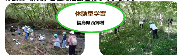
体験型学習 福島県西郷村

森のめぐみをテーマとして、「体験型森林環境学習」「森の調査・研究」を柱に活動を行っています。