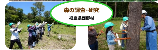
森の調査・研究 福島県西郷村